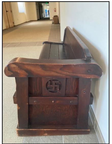
万字(卍)の彫り物がついたベンチ

本堂のこの新しいアメリカ製合板の劇場型椅子の計画は約2ヶ月半で設置完了。洗心仏教会から最近借りて一時的に使用していた椅子と取り替える予定です。疎開前に使われていた通常の木製ベンチは、疎開者の所有物を保管する場所を確保するために売却されました。 YBAのメンバーが新しい椅子の頻繁な使用者になると考えられたので、椅子一席あたり$100の寄附がお願いされていますが、ご希望の方ならどなたからも受け付けています。一席$100の寄附につき、椅子(背面)には寄贈者の名前を示す付箋が付けられます。